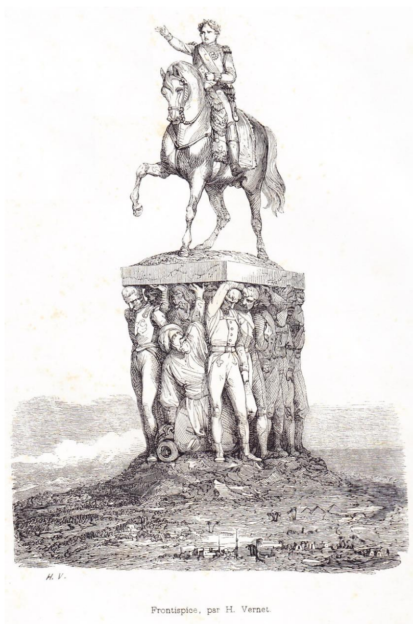
Frontispice, par H. Vernet.